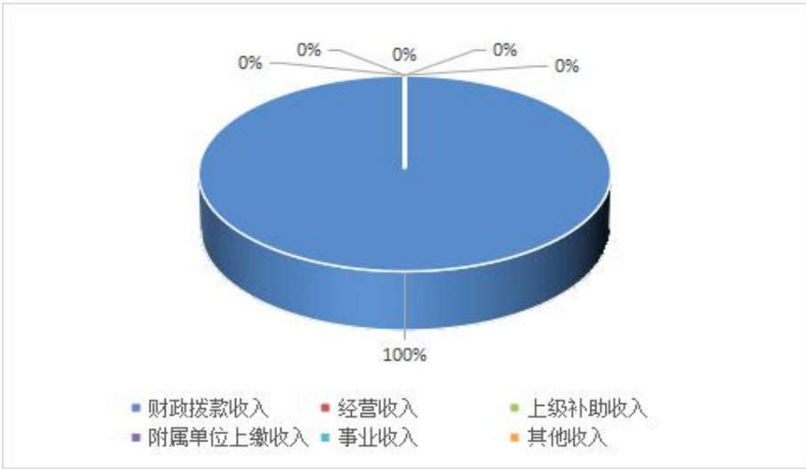
图 2 收入决算结构

2024 年度支出合计 77.21 万元，与 2023 年度相比，支出合计增加 4.57 万元，增长 6.3%。其中：基本支出 74.21 万元，占比 96.1%；项目支出 3 万元，占比 3.9%；上缴上级支出 0 万元，占本年支出 0%；经营支出 0 万元，占本年支出 0%；对附属单位补助支出 0 万元，占本年支出 0%。