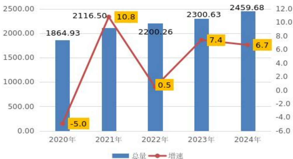
图 1 2020-2024 年地区生产总值（亿元）及其增长速度（%）

年末全市常住人口 255.07 万人，城镇化率为 62.20%，比上年末提高 1.0 个百分点。全年人口出生率 4.35‰，死亡率 7.49‰，自然增长率-3.14‰。